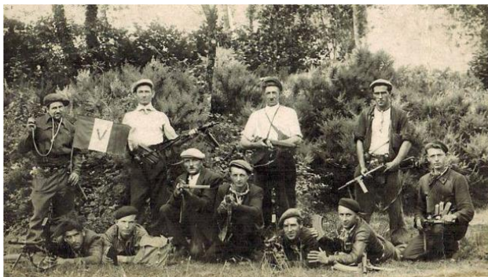
Un groupe de résistants photographié pendant l'été 1944.