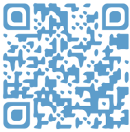
Vidéo 1 - L'appel du 18 juin 1940