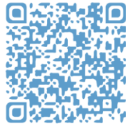
Vidéo 2 - C'est quoi la Résistance ?

Activité à faire en salle de lecture : observe les vidéos à l'aide des liens QR Code et réponds aux questions sur ces vidéos.