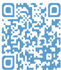
Vidéo 1 - Pétain et le régime de Vichy