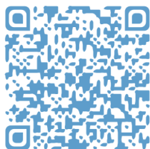
Vidéo 2 - La collaboration

Activité à faire en salle de lecture : observe les vidéos à l'aide des liens QR Code et relève dans ces vidéos toutes les informations qui te paraissent pertinentes afin de comprendre ce qu'est le régime de Vichy.