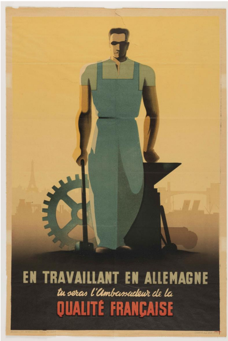
Affiche d'Eric Castel, 1943.